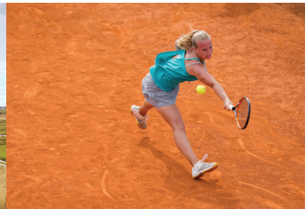
Carlos Delgado, CC-BY-SA 3.0