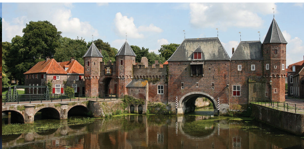
Bert, CC-BY-SA 2.0