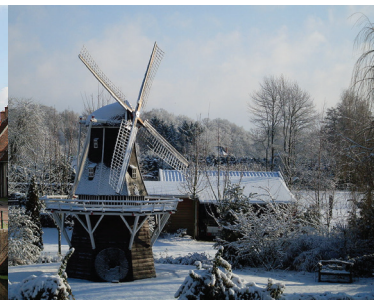
Walter Vaags, CC-BY-SA 3.0