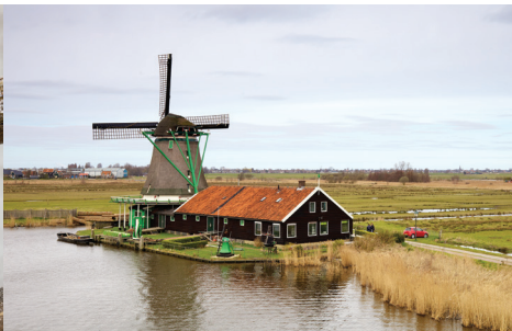
Murdockcrc, CC-BY 3.0